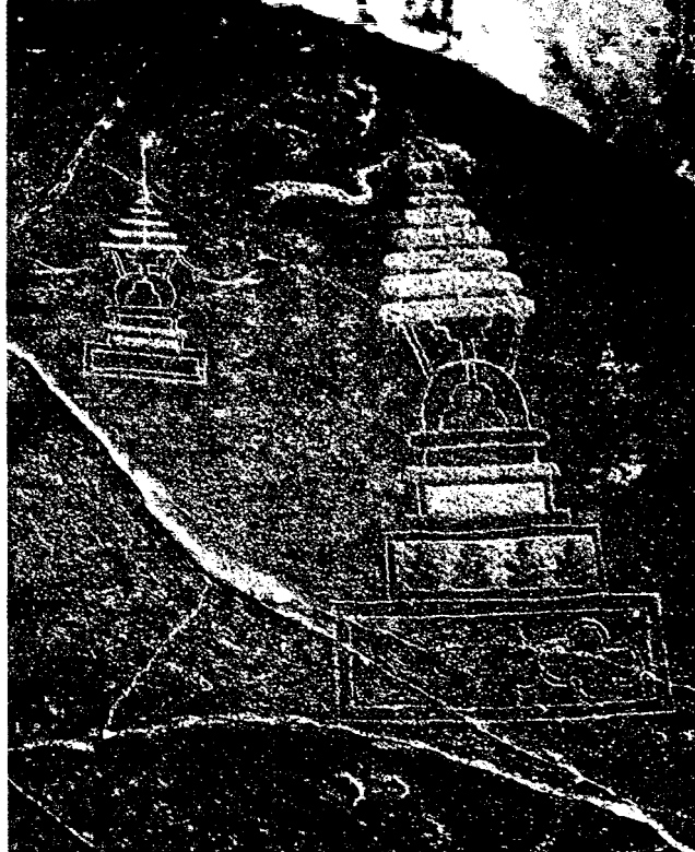
Наскальное изображение буддийской молельни на Великом шелковом пути.

Наступил день, когда исследователи, измерявшие дневную температуру коричневых гранитов, столкнулись с важным открытием — на скалах они увидели орнаменты и рисунки, которые после анализа решительно отнесены к окуневской культуре. Они говори-